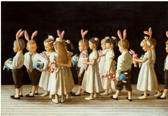
Maria Safronova, The General Outlook Game: New Year , 2013