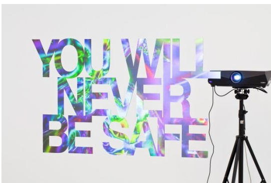
Pennacchio Argentato, YOU WILL NEVER BE SAFE , 2013