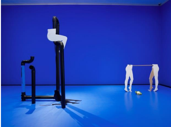
Anthea Hamilton, Installation view of CUT OUTS , 2012

Beelden kunnen gedownload worden via www.muhka.be/pers